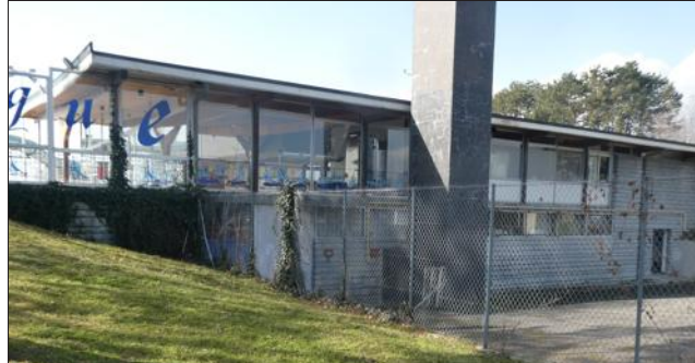
Le bâtiment des années 1960 est l'œuvre de Maurice Novarina.

Cette réfection totale engendre un investissement de l'ordre de 1,1 million d'euros pour la Ville,