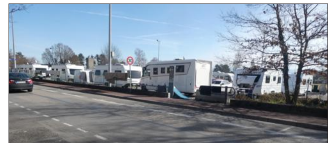
Des caravanes occupent l'ancien terrain de foot depuis vendredi.

L'ancien terrain de foot, devenu un parking, en face du Centre nautique, entre l'avenue des Alpes et la rue du Port, est occupé depuis vendredi 24 février par une quarantaine de caravanes et autres véhicules de forains. Le gabarit d'entrée a été forcé, la chaîne du portail a été cisailée. Cette occupation illégale du terrain s'accompagne de branchements tout aussi illégaux sur les réseaux électrique et d'alimentation en eau, sans parler des ordures accumulées à l'entrée du terrain. Les occupants ont déclaré vouloir se rendre sur l'aire des gens du voyage de Prévessin-Moëns, dépendant de la CAPG (Communauté d'agglomération du Pays de Gex). Or elle est actuellement en travaux pour une durée indéterminée... La commune de Divonne-les-Bains a porté plainte et se tient en relation avec la gendarmerie de Gex et la CAPG. Elle déplore d'autant plus cette occupation, qu'elle possède elle-même une aire permanente dédiée aux gens du voyage, en face du magasin Carrefour.